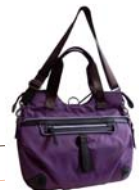
5 Ways Borsa Multi Funzionale Rialto